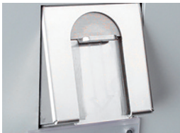
Fente à monnaies anti-vandalisme