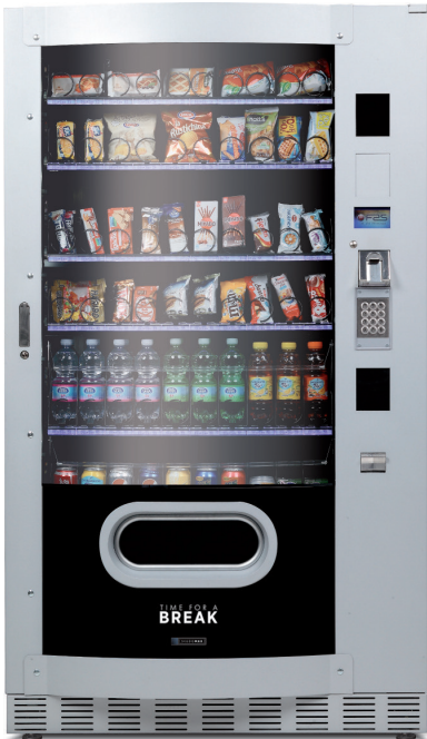
Skudo Max GCD 1050