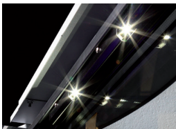
Éclairage intérieur avec power led latérales et supérieures