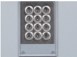
Clavier eclaire protégé par une membrane en Lexan de 5 mm